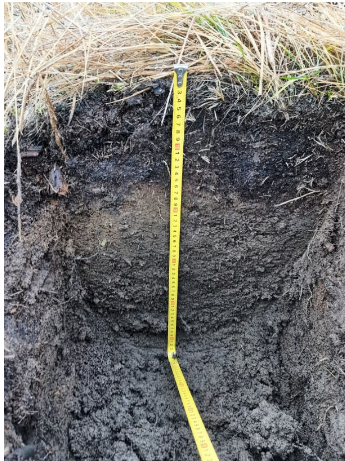
Рисунок 3.4 - Почвенный профиль