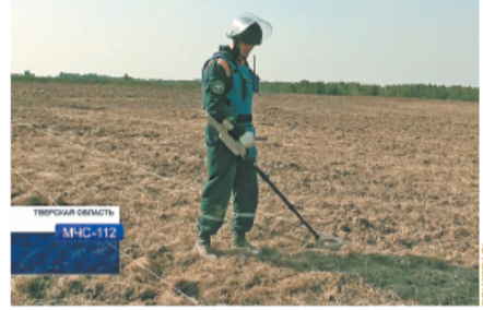
Работа спасателей по поиску боеприпасов вблизи мемориала не только опасна, но и кропотлива.

В МЧС России сообщили, что в двух районах Тверской области, Ленинском и Ржевском, специалисты центра по проведению работ особого риска «Лидер» приступают к масштабному разминированию полей, необходимым для проведения сельскохозяйственных работ. Как оказалось, даже спустя 75 лет, на землях оккупации войны, на древних полях и в лесах продолжают находить смертельные скоририды из прошлого.