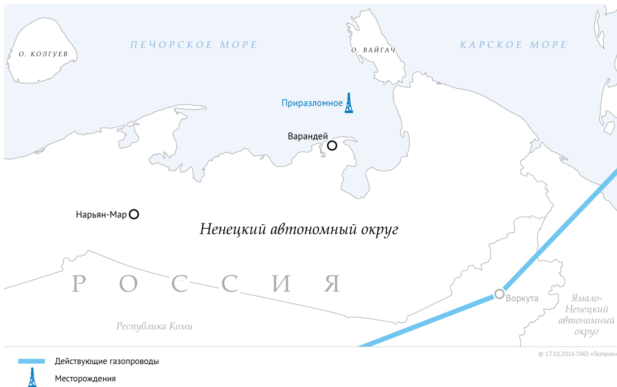
Рисунок 2.2 - Обзорная схема района работ.

Район работ расположен в восточной части Печорского моря, в 60 км от берега (рисунок 2.2). Ближайшим населенным пунктом является поселок Варандей Ненецкого автономного округа. Основным морским портом служит г. Мурманск, ближайший к району работ – порт Нарьян-Мар.