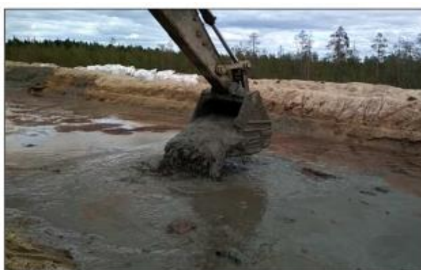
Рисунок 2.3 – Подготовка шлама бурового

Помимо подготовки участка на шламонакопителе производилась подготовка бурового шлама. Подготовка включала в себя мероприятия по доведению его консистенции, позволяющей транспортировку автосамосвалом. В шлам буровой вносили портландцемент ПЦ500 Д0 с последующим перемешиванием шлама экскаватором (рисунок 2.3). Количество цемента подбиралось таким образом, чтобы быть достаточным (3% по массе) для достижения консистенции, которая позволит осуществить разработку шламонакопителя экскаватором и использовать для перевозки автосамосвалы.