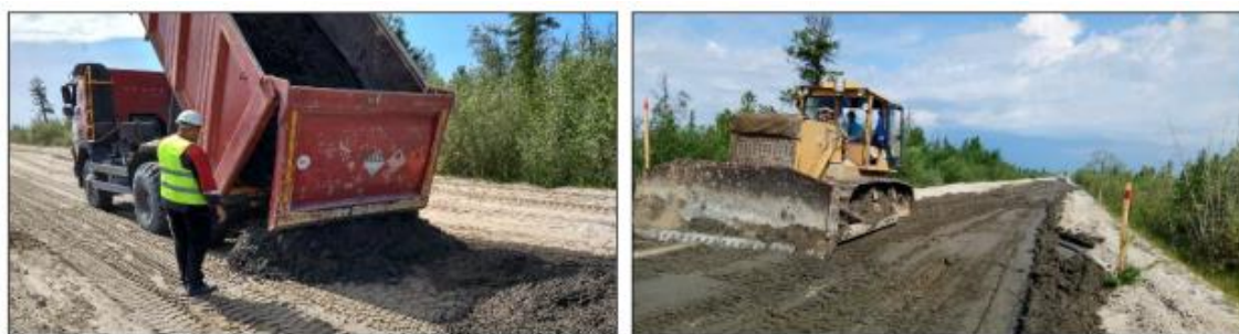
а б Рисунок 2.5 – Распределение и планировка подготовленного бурового шлама а – разгрузка шлама в валик; б – распределение и уплотнение шлама бульдозером

Распределение и планировка подготовленного бурового шлама. Подготовленный шлам разрабатывался в шламонакопителе экскаватором с погрузкой в автосамосвалы, в которых он транспортировался к участку строительства. Выгрузка осуществлялась в вал по оси будущего слоя. После чего проводилось распределение бурового шлама слоем 10-15 см бульдозерами и автогрейдерами. Отсыпанный слой проектной толщины разравнивался с учетом продольного уклона поверхности. В поперечном сечении поверхность слоя планировалась под проектный профиль. Фотографии процесса распределения и планировки бурового шлама представлены на рисунке 2.5.