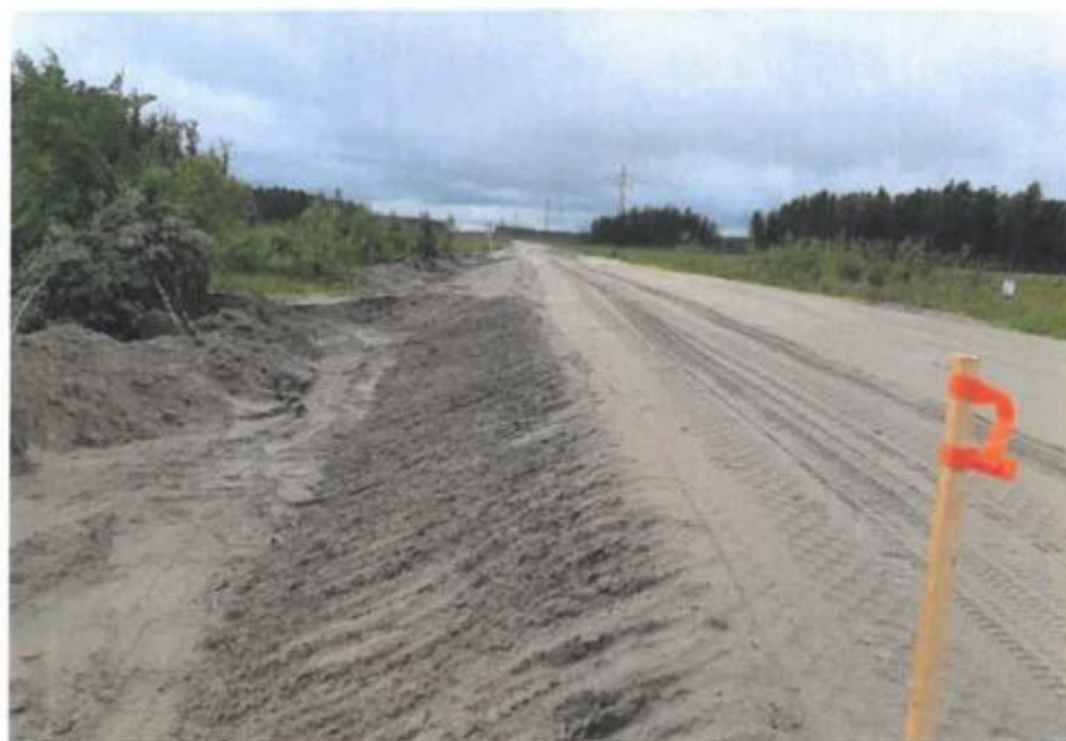
Рис. 2.13 - Вид насыпи после досыпки с сформированной откосной частью Доставка минерального вяжущего осуществлялась автотранспортными средствами из г. Сургут. Транспортировка и выгрузка осуществлялась к месту проведения работ.

Битумная эмульсия производилась на производственной базе в г. Ханты-Мансийск, дальность транспортировки составила 65 км. Емкостной парк для накопления битумной эмульсии состоял из двух емкостей объемом по 25 м 3 .