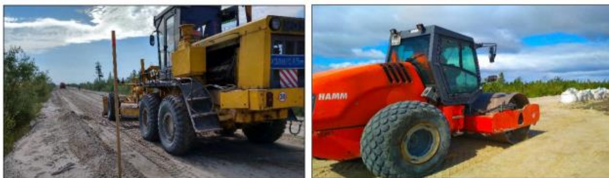
а б Рисунок 2.4 – Процесс подготовки песчаного слоя а – планировка слоя; б – уплотнение песка катком НАММ 3411

Отсыпка, планировка и уплотнение укрепляемого слоя песка. Перед распределением шлама бурового на участке производства работ выполнялась отсыпка, планировка основания и уплотнение грунта. Для отсыпки использовался местный песок гидронамывной. Уплотнение велось при влажности близкой к оптимальной. В качестве уплотняющей машины выступал грунтовый каток НАММ 3411. Процесс подготовки песчаного слоя представлен на рисунке 2.4.