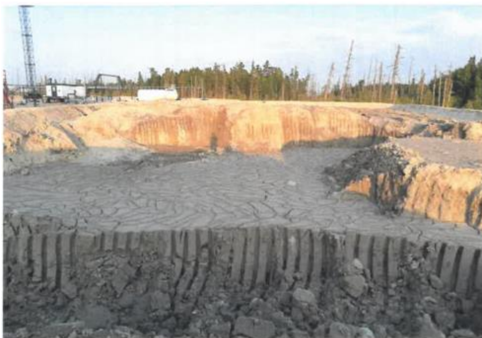
Рис. 2.15 – Техногрунт «Ресойл»

Материал «Ресойл» соответствовал необходимым параметрам, в том числе по влажности, не требовал предварительной подготовки, его можно было сразу использовать в работах по устройству конструктивных слоев дорожной одежды.