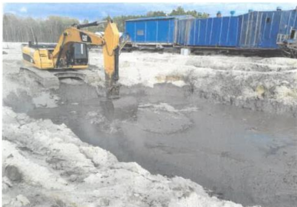
Рис. 2.14 - Подготовка шлама бурового на кустовой площадке

Для подготовки шлама бурового в шламонакопитель добавляли портландцемент марки ПЦ 400 в количестве 3-4% с последующим тщательным перемешиванием ковшем экскаватора. Полученную смесь выдерживали в течение 1 суток и затем транспортировали к месту проведения работ.