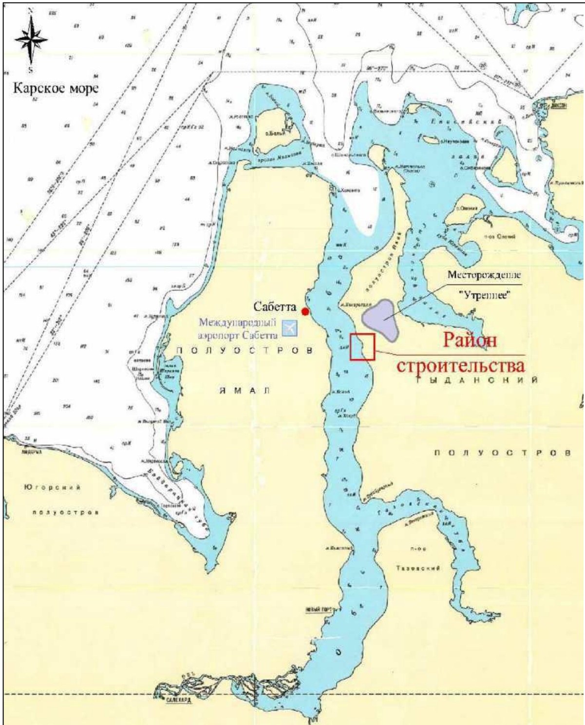
Рисунок 1.2 – Расположение района строительства акватории участка 4 причальной набережной Терминала «Утренний»

Расположение района строительства акватории участка 4 причальной набережной Терминала «Утренний» приведено на рисунке 1.2.