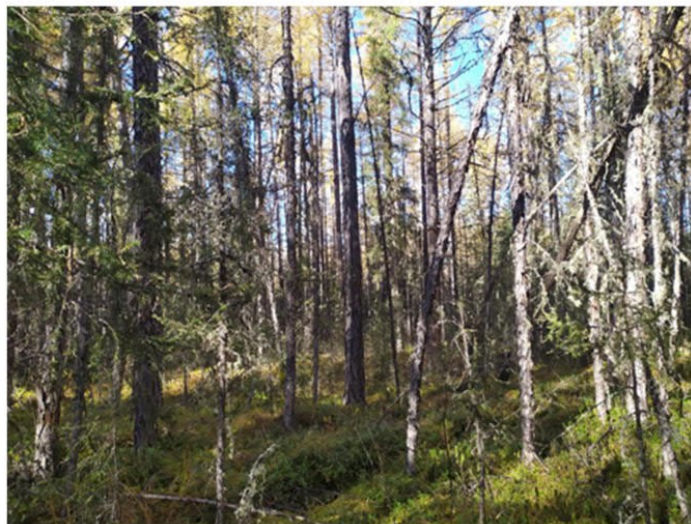
Рис. 1.26 Лиственничник зеленомошный

Площадка расположена в юго-восточной части участка. Условия увлажнения атмосферно-грунтовые. Антропогенное воздействие не обнаружено. Формула древостоя Л10, сомкнутость крон 0,5. Лиственница высота средняя 16 м, максимальная 17 м, диаметр 15 см, максимальный 18 см. Степень покрытия древесного яруса – 60%. Степень покрытия кустарникового яруса – 5%. Степень покрытия травяного яруса – 40%. Степень покрытия мохово-лишайникового яруса – 90%. Основные виды на площадке: Larix gmelinii , Betula divaricata , Vaccinium vitis-idaea , Carex globularis , Aulacomnium palustre , Rhytidium rugosum . Растительная ассоциация – лиственничник зеленомошный (рис. 1.26).