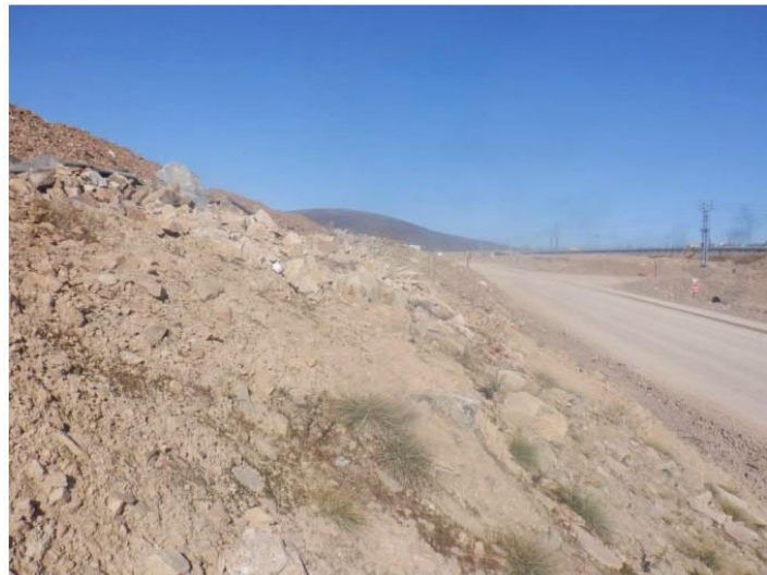
Рис. 1.33 Грунтовые дороги на территории объекта изысканий

По результатам маршрутных обследований, в границах участка проектирования виды растений, занесенные в Красную книгу Российской Федерации и Красную книгу Республики Саха, отсутствуют.