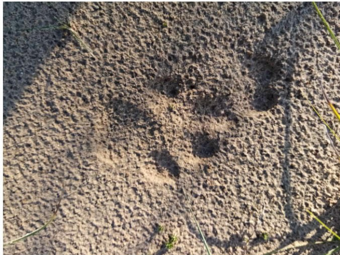
Рис. 1.35 След волка