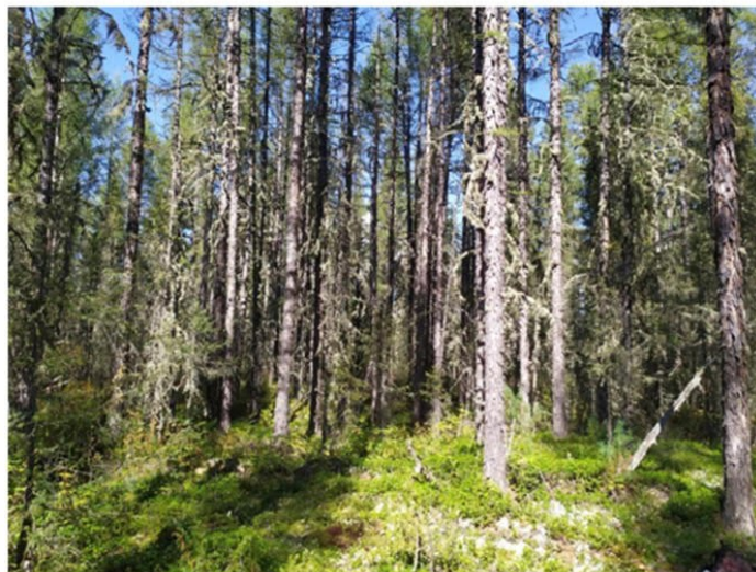
Рис. 1.20 Зрелый лиственничный лес

Площадка расположена в центральной части участка. Условия увлажнения атмосферно-грунтовые. Антропогенное воздействие не обнаружено. Формула древостоя ЛБП4, сомкнутость крон 0,3. Степень покрытия древесного яруса – 40%. Степень покрытия кустарникового яруса – 5%. Степень покрытия травяного яруса – 40%. Степень покрытия мохово-лишайникового яруса – 70%. Основные виды на площадке: Larix gmelinii , Betula divaricata , Rosa acicularis , Vaccinium vitis-idaea , Rhytidium rugosum , Cladonia stellaris , Cladonia arbuscula , Peltigera didactyla . Растительная ассоциация – зрелый лиственничный лес (рис. 1.20).