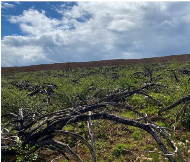
Рис. 1.28 Ерник вейниково-кустарничковый

Растительная ассоциация: ерник вейниково-кустарничковый.