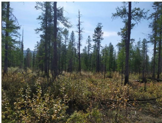
Рис. 1.16 Лиственничник ерниковый