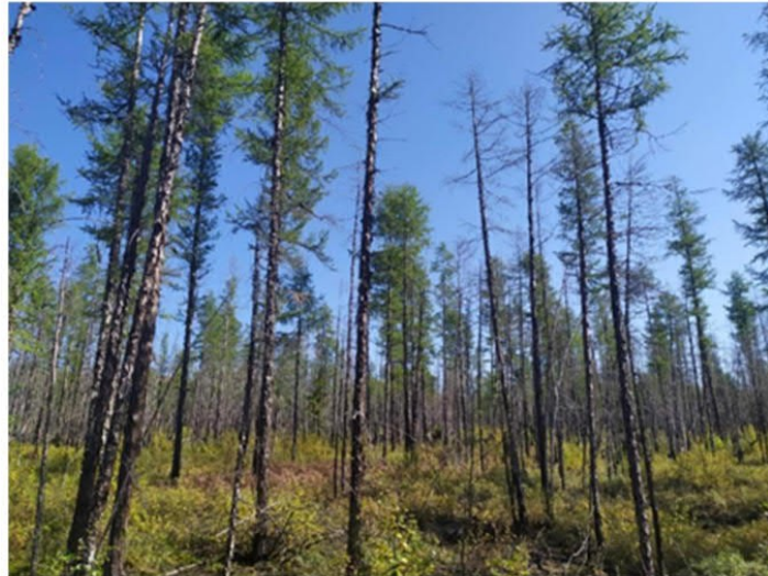
Рис. 1.6 Лиственничное редколесье