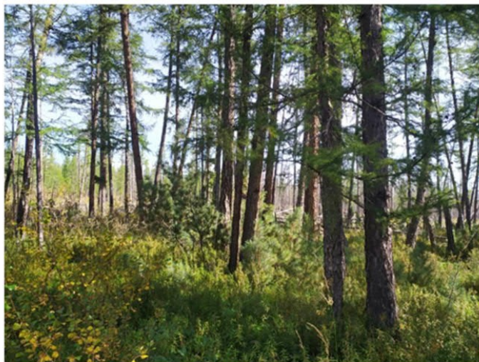
Рис. 1.15 Долинный лиственничник

Площадка расположена в восточной части участка. Условия увлажнения атмосферно-грунтовые, 1-я надпойменная терраса реки Левый Усу. Антропогенное воздействие не обнаружено. Формула древостоя Л10, сомкнутость крон 0,4. Лиственница высота средняя 18 м, максимальная 24 м, диаметр 18 см, максимальный 23 см. Степень покрытия древесного яруса – 30%. Степень покрытия кустарникового яруса – 10%. Степень покрытия травяного яруса – 90%. Степень покрытия мохово-лишайникового яруса – 20%. Основные виды на площадке: Larix gmelinii , Betula divaricata , Pinus pumila , Ledum palustre , Vaccinium uliginosum , Calamagrostis langsdorffii , Rhododendron aureum , Carex globularis , Ceratodon purpureus , Pleurozium schreberi . Растительная ассоциация: долинный лиственничник (рис. 1.15).