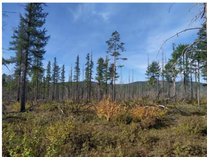
Рис. 1.13 Лиственничник ерnikовo-голубичный