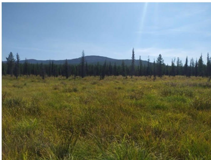
Рис. 1.17 Осоковое болото

Площадка расположена в юго-восточной части участка. Условия увлажнения атмосферно-грунтовые. Рельеф бугристо-мочажинный. Антропогенное воздействие не обнаружено. Степень покрытия кустарникового яруса – 30%. Степень покрытия травяного яруса – 80%. Степень покрытия мохово-лишайникового яруса – 20%. Основные виды на площадке: Betula divaricata , Carex schmidtii , C. enervis , Parnassia palustris , Calamagrostis langsdorffii , Eriophorum vaginatum , Galium trifidum , Ranunculus lapponicus , Climacium dendroides . Растительная ассоциация – осоковое болото ( рис. 1.17 ).