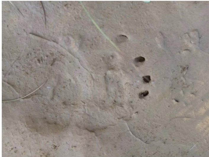
Рис. 1.34 След медведя

дубровник, фоновые виды: буроголовая гаичка, вьюрок, желтая трясогузка, вертишейка и сорокопут-жулан. В лиственничных лесах на склонах гор обычны восемь видов птиц, плотность населения которых равна 74,9 особей/км 2 . Здесь чаще отмечается чечетка и буроголовая гаичка, обычны пятнистый конек, вьюрок и кедровка. В лиственничных распадках регулярно встречается 29 видов птиц, численность которых составляет 344,9 особей/км 2 . Доминирует дубровник, многочисленны рыжая овсянка, соловей-красношейка, синехвостка, обычные виды – пятнистый конек, обыкновенная чечевица, соловей-свистун, сибирская мухоловка, зеленая пеночка, глухая кукушка, седоголовая овсянка.