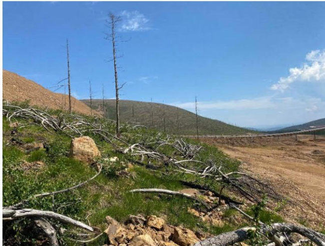
Рис. 1.29 Ерник кустарничково-вейниковый.