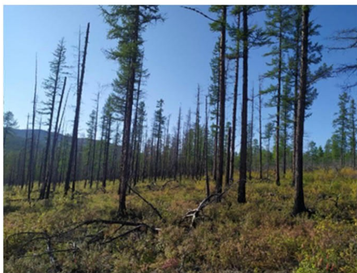
Рис. 1.12 Молодой лиственничник голубичный

Площадка расположена в центральной части участка. Экспозиция 210°, угол наклона поверхности 7°. Условия увлажнения атмосферно-грунтовые. Антропогенное воздействие: прошел низовой пожар, сгорел кедровый стланик. Формула древостоя Л10, сомкнутость крон 0,1. Лиственница высота средняя 11 м, диаметр 14 см, максимальный 15 см. Степень покрытия древесного яруса – 15%. Степень покрытия кустарникового яруса – 1%. Степень покрытия травяного яруса – 60%. Степень покрытия мохово-лишайникового яруса – 2%. Основные виды на площадке: Larix gmelinii , Betula divaricata , Vaccinium uliginosum , Ledum palustre , Abietinella abietina . Растительная ассоциация: молодой лиственничник голубичный (рис. 1.12).