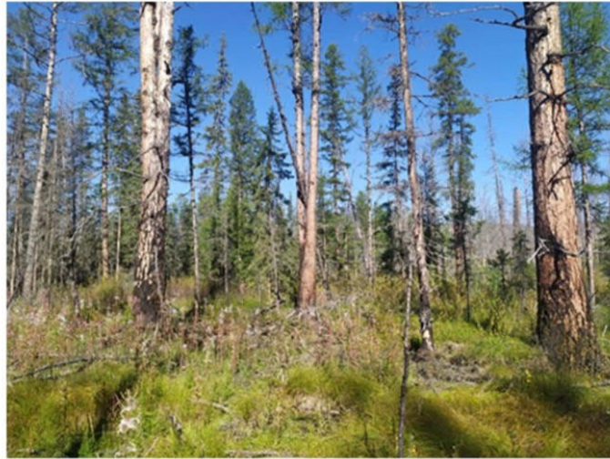
Рис. 1.5 Лиственничное редколесье