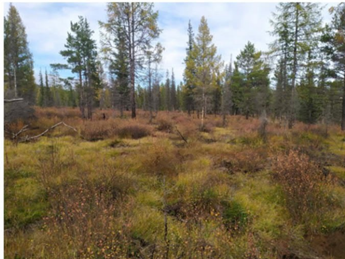
Рис. 1.23 Ерник осоковый зеленомошный

Площадка расположена в юго-восточной части основного контура участка. Экспозиция 177°, очень пологий склон. Условия увлажнения атмосферно-грунтовое, первая надпойменная терраса р. Левый Усу. Степень покрытия кустарникового яруса – 7%. Степень покрытия травяного яруса – 80%. Степень покрытия мохово-лишайникового яруса 40%. Основные виды на площадке: Betula divaricata , Carex globularis , C. pallida , Vaccinium vitis-idaea , Polytrichum commune , Rhytidium rugosum . Растительная ассоциация: Ерник осоковый зеленомошный (рис. 1.23).