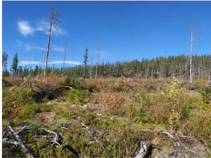
Рис. 1.22 Ерник осоково-багульниковый