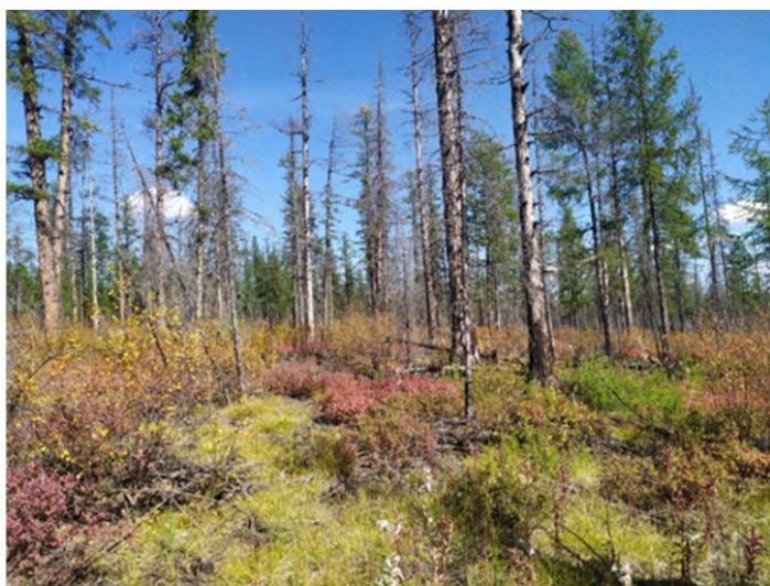
Рис. 1.21 Ерник голубично-осоковый

Площадка расположена в северо-восточной части основного контура участка. Экспозиция 177°, очень пологий склон. Условия увлажнения атмосферно-грунтовые. Антропогенное воздействие: был сильный низовой пожар, в результате на месте лиственничника сформировался ерник. Сообщество на вторичной стадии восстановления. Степень покрытия кустарникового яруса – 10%. Степень покрытия травяного яруса – 60%. Степень покрытия мохово-лишайникового яруса 5%. Основные виды на площадке: Betula divaricata , Carex globularis , C. pallida , Vaccinium uliginosum , возобновление Pinus pumila и Larix gmelinii , Polytrichum commune , Rhytidium rugosum . Растительная ассоциация – ерник голубично-осоковый (рис. 1.21).