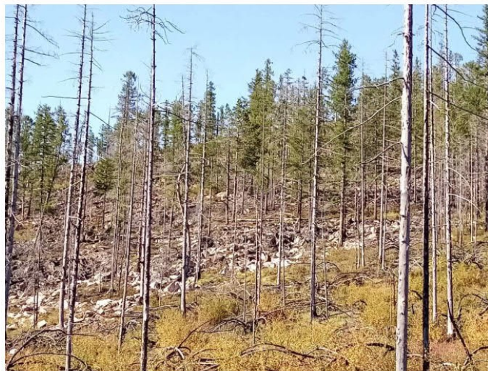
Рис. 1.31 Участок, пройденный низовым пожаром

Антропогенные нарушения растительного покрова на обследованной территории различаются по виду и мощности. В основном это участки после низовых пожаров (рис. 1.27), линейные нарушения, обусловленные дорогами и отвалами грунта (рис. 1.28) и коммуникациями (рис. 1.29). В связи с этим влиянием в большинстве случаев растительность находится на разных стадиях восстановления.