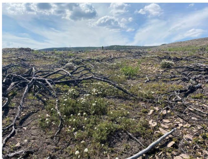
Рис. 1.27 Кустарничковая пустошь

Растительная ассоциация: кустарничковая пустошь (рис. 1.27).