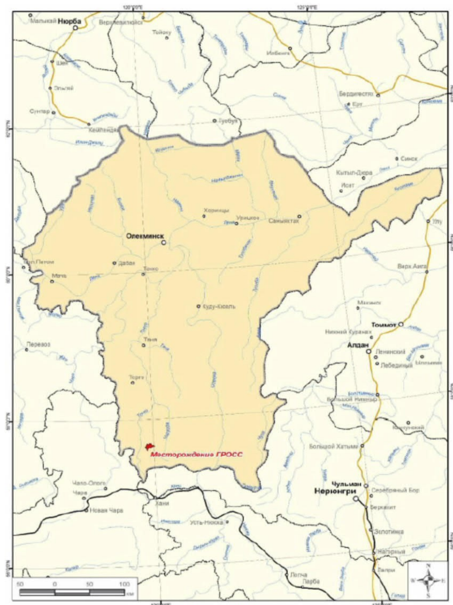
Рисунок 1. Обзорная схема.

Отчет об организации и о результатах осуществления производственного экологического контроля направляется в Управление Росприроднадзора по Республике Саха (Якутия).