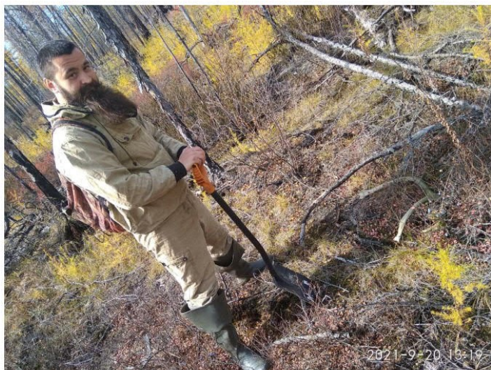
Рис. 1.38 Рога оленя