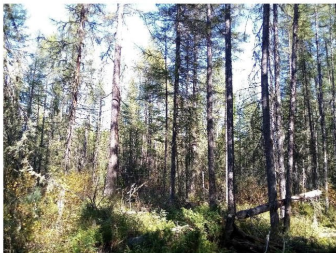
Рис. 1.2 Лиственный лес