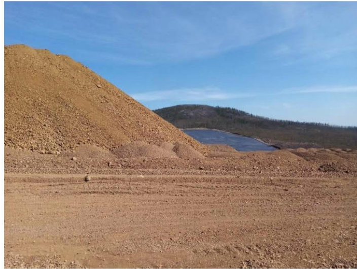
Рис. 1.32 Участок производства земляных работ на территории объекта изысканий