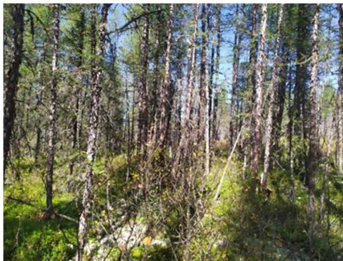
Рис. 1.7 Молодой лиственничник