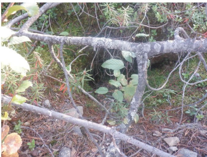
Рис. 1.37 Зброшенная нора лисицы