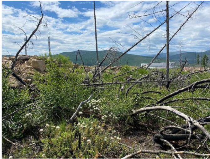
Рис. 1.30 Ерник кустарничковый

Антропогенные нарушения растительного покрова на обследованной территории различаются по виду и мощности. В основном это участки после низовых пожаров (рис. 1.27), линейные нарушения, обусловленные дорогами и отвалами грунта (рис. 1.28) и коммуникациями (рис. 1.29). В связи с этим влиянием в большинстве случаев растительность находится на разных стадиях восстановления.