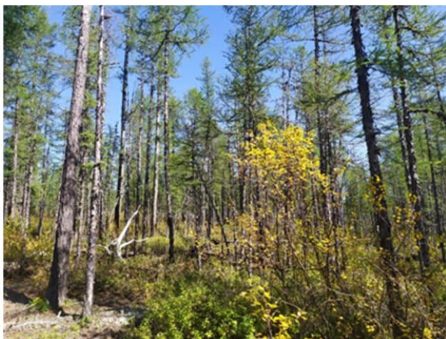
Рис. 1.9 Молодой лиственничник ерниковый

Площадка расположена в юго-восточной части участка. Экспозиция 185°, угол наклона поверхности 12°. Условия увлажнения атмосферно-грунтовые. Антропогенное воздействие не обнаружено. Формула древостоя Л10С+, сомкнутость крон 0,1. Сосна высота средняя 12 м, максимальная 15 м, лиственница высота средняя 9 м, максимальная 12 м. Сосна – диаметр 13 см, максимальный 16 см, лиственница – диаметр 8 см, максимальный 10 см. Степень покрытия древесного яруса – 30%. Степень покрытия кустарникового яруса – 10%. Степень покрытия травяного яруса – 20%. Степень покрытия мохово-лишайникового яруса – 10%. Основные виды на площадке: Larix gmelinii , Pinus sylvestris , Betula divaricata , подпочт Larix gmelinii , Vaccinium uliginosum , Selaginella borealis , Empetrum subholarcticum , Carex pediformis , Rhytidium rugosum . Растительная ассоциация: молодой лиственничник ерниковый (рис. 1.9).