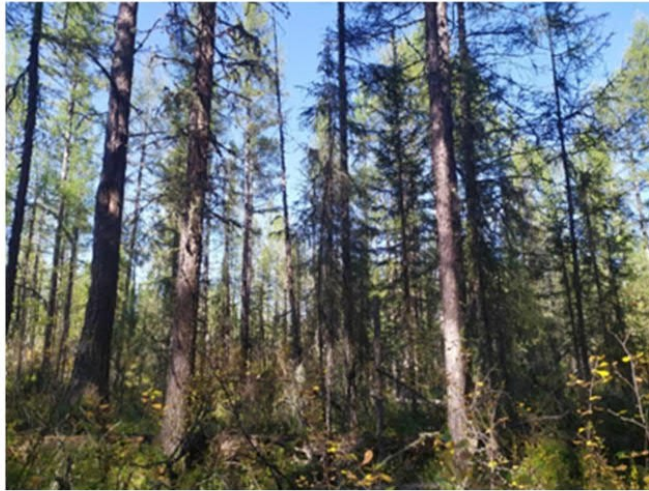
Рис. 1.10 Лиственничник долинный