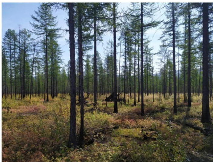
Рис. 1.14 Лиственничное редколесье

Площадка расположена в центральной части участка. Экспозиция 125°, угол наклона поверхности 5°. Условия увлажнения атмосферно-грунтовые. Антропогенное воздействие: рядом были пожары, но участок был мало затронут огнем. Лиственница высота средняя 13 м, максимальная 16 м, диаметр 13 см, максимальный 24 см. Степень покрытия древесного яруса – 10%. Степень покрытия кустарникового яруса – 3%. Степень покрытия травяного яруса – 35%. Степень покрытия мохово-лишайникового яруса 3%. Основные виды на площадке: Larix gmelinii , Betula divaricata , Vaccinium uliginosum , Polytrichum commune . Растительная ассоциация: Лиственничное редколесье (рис. 1.14).