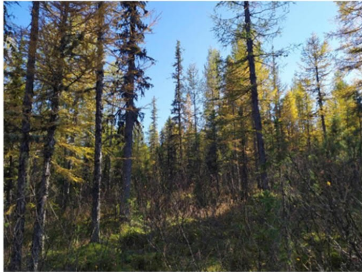
Рис. 1.25 Лиственничный лес