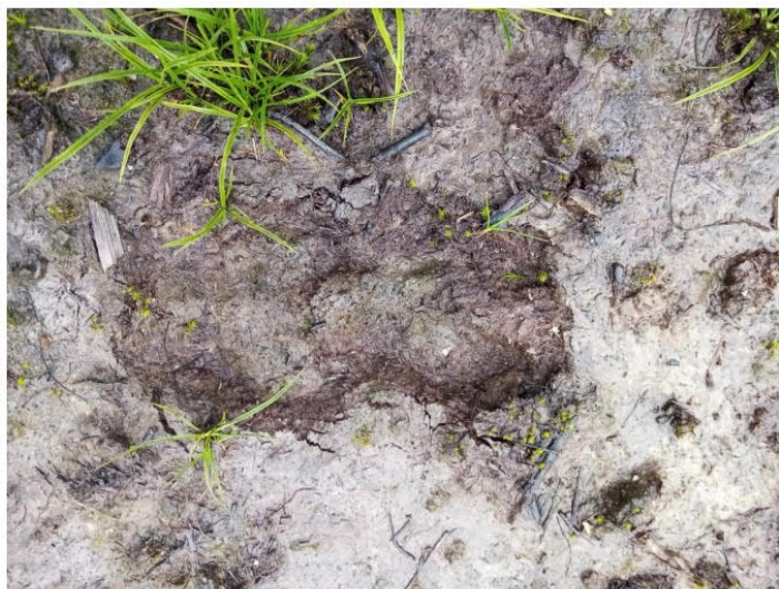
Рис. 1.36 След косули