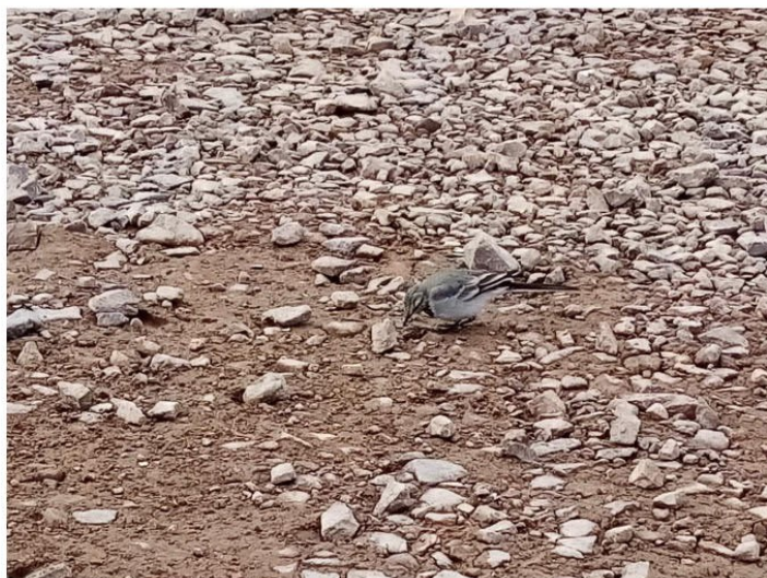
Рис. 1.39 Белая трясогузка

По результатам маршрутных обследований, в границах участка проектирования виды животных, занесенные в Красную книгу Российской Федерации и Красную книгу Республики Саха, отсутствуют.