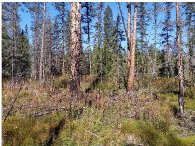
Рис. 1.4 Лиственничник вейниково-осоковый

Площадка расположена в юго-западной части участка. Экспозиция 145°, угол наклона поверхности 2°. Условия увлажнения атмосферно-грунтовые. Антропогенное воздействие не обнаружено. Формула древостоя Л10, сомкнутость крон 0,3. Лиственница высота средняя 11 м, максимальная 14 м. Лиственница – диаметр 13 см, максимальный 22 см. Степень покрытия древесного яруса – 40%. Степень покрытия кустарникового яруса – 20%. Степень покрытия травяного яруса – 85%. Степень покрытия мохово-лишайникового яруса – 30%. Основные виды на площадке: Larix gmelinii , Betula divaricata , Carex amgunensis , C. schmidtii , Rosa acicularis , Calamagrostis lanfsdorffii , Rhytidium rugosum , Polytrichum commune . Растительная ассоциация – лиственничник вейниково-осоковый (рис. 1.4).