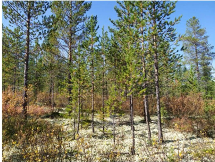
Рис. 1.19 Сосновое редколесье ерниковое беломошное