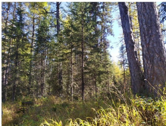
Рис. 1.24 Долинный лиственничный лес

Площадка расположена в юго-восточной части участка. Условия увлажнения атмосферно-грунтовые. Рельеф бугристо-мочажинный. Антропогенное воздействие не обнаружено. Формула древостоя Л10, сомкнутость крон 0,6. Лиственница высота средняя 17 м, максимальная 20 м. Лиственница – диаметр 24 см, максимальный 30 см. Степень покрытия древесного яруса – 50%. Степень покрытия кустарникового яруса – 10%. Степень покрытия травяного яруса – 60%. Степень покрытия мохово-лишайникового яруса – 85%. Основные виды на площадке: Larix gmelinii , Betula divaricata , Rosa acicularis , Calamagrostis epigeios , Linnaea borealis , Carex globularis , Vaccinium vitis-idaea , Rhododendron aureum , Aulacomnium palustre , Polytrichum commune , Rhytidium rugosum . Растительная ассоциация – долинный лиственничный лес (рис. 1.24).