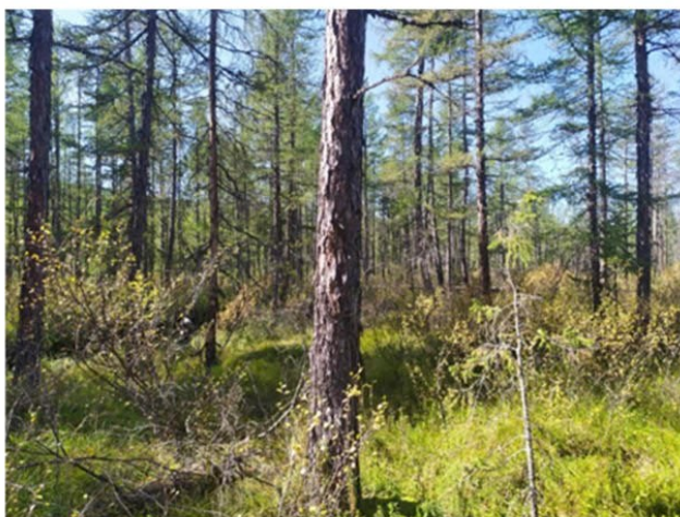
Рис. 1.8 Редкостойный лиственничник ерниково-осоковый

Площадка расположена в южной части участка, на надпойменной террасе р. Левый Усу. Экспозиция 195°, угол наклона поверхности 2°. Условия увлажнения атмосферно-грунтовые. Рельеф бугристо-западинный. Антропогенное воздействие не обнаружено. Лиственница высота средняя 10 м, максимальная 13 м, диаметр 15 см, максимальный 20 см. Степень покрытия древесного яруса – 10%. Степень покрытия кустарникового яруса – 30%. Степень покрытия травяного яруса – 80%. Степень покрытия мохово-лишайникового яруса – 35%. Основные виды на площадке: Larix gmelinii , Betula divaricata , Carex amgunensis , Vaccinium vitis-idaea , Vaccinium uliginosum , Ceratodon purpureus . Растительная ассоциация: Редкостойный лиственничник ерниково-осоковый (рис. 1.8).