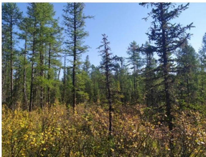
Рис. 1.3 Ерник травяно-голубичный

Площадка расположена в юго-западной части участка. Экспозиция 115°, угол наклона поверхности 3°. Условия увлажнения атмосферно-грунтовые. Антропогенное воздействие не обнаружено. Лиственница высота средняя 14 м. Лиственница – диаметр 14 см. Степень покрытия древесного яруса – 3%. Степень покрытия кустарникового яруса – 40%. Степень покрытия травяного яруса – 50%. Степень покрытия мохово-лишайникового яруса – 80%. Основные виды на площадке: Larix gmelinii , Betula divaricata , Carex globularis , Vaccinium uliginosum , Vaccinium vitis-idaea , Ledum palustre , Rhytidium rugosum , Polytrichum commune . Растительная ассоциация – ерник травяно-голубичный (рис. 1.3).