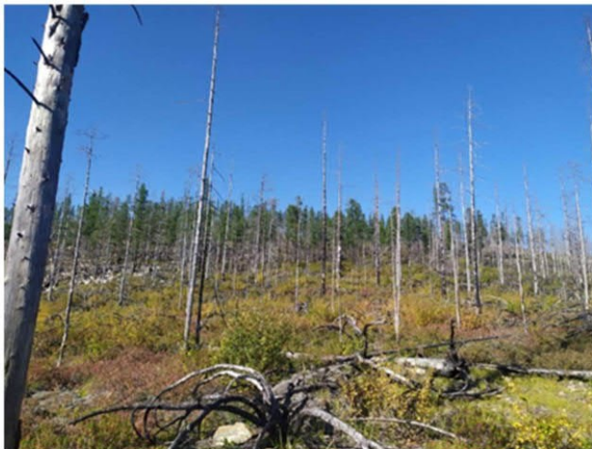
Рис. 1.11 Ерник травяно-голубичный

Площадка расположена в центральной части участка. Экспозиция 210°, угол наклона поверхности 7°. Условия увлажнения атмосферно-грунтовые. Антропогенное воздействие: был сильный низовой пожар, в результате на месте лиственничник сформировался ерник, много сгоревших кустов кедрового стланика. Сообщество на первичной стадии восстановления. Степень покрытия кустарникового яруса – 10%. Степень покрытия травяного яруса – 20%. Степень покрытия мохово-лишайникового яруса <1%. Основные виды на площадке: Betula divaricata , Vaccinium uliginosum , Ledum palustre , Vaccinium vitis-idaea , Calamagrostis langsdorffii , Carex duriuscula , возобновление Pinus pumila , Polytrichum commune . Растительная ассоциация – ерник травяно-голубичный (рис. 1.11).