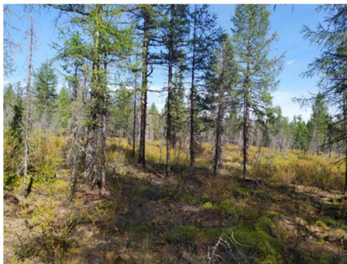
Рис. 1.18 Лиственничник ерниковый

Площадка расположена в северо-восточной части участка. Экспозиция 150°, угол наклона поверхности 4°. Условия увлажнения атмосферно-грунтовые. Антропогенное воздействие не отмечено. Лиственница высота средняя 11 м, максимальная 13 м. Лиственница – диаметр 10 см, максимальный 15 см. Степень покрытия древесного яруса – 35%. Степень покрытия кустарникового яруса – 15%. Степень покрытия травяного яруса – 5%. Степень покрытия мохово-лишайникового яруса – 20%. Основные виды на площадке: Larix gmelinii , Betula divaricata , Carex globularis , Rhytidium rugosum . Растительная ассоциация: лиственничник ерниковый (рис. 1.18).