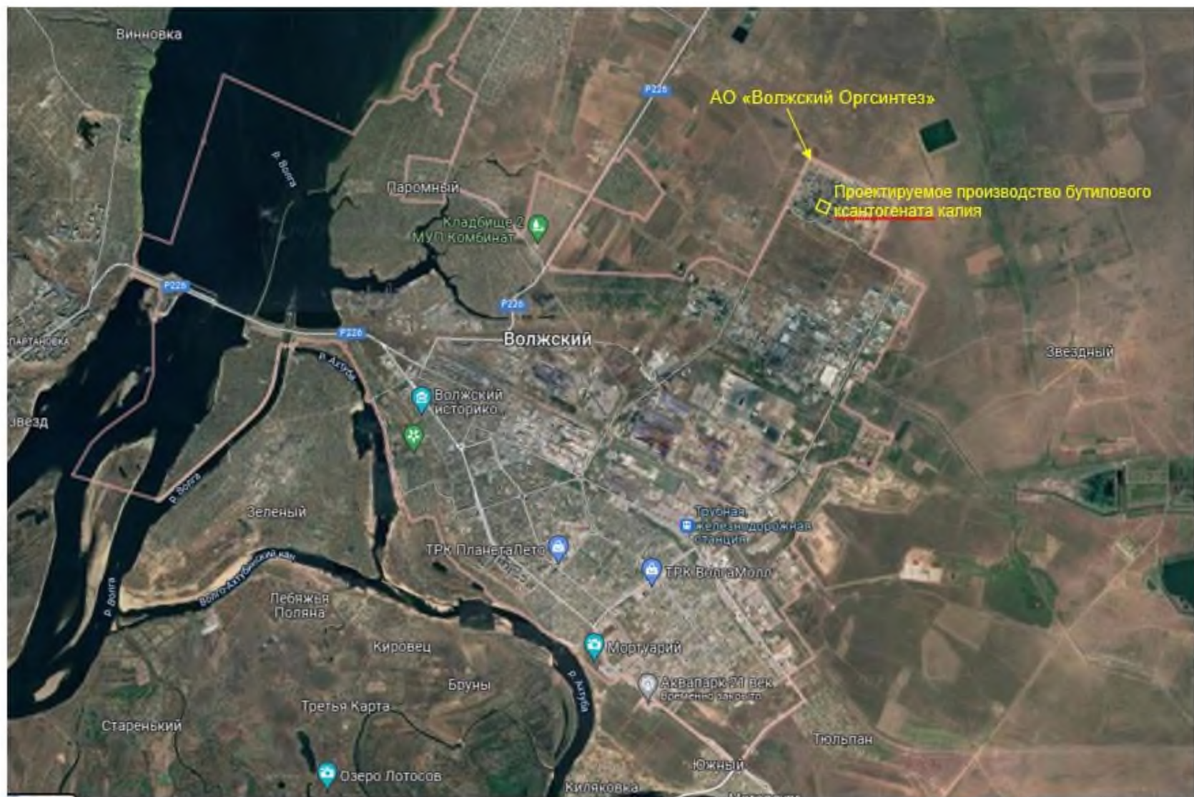
Рис. 1.1 Ситуационная карта-схема с указанием места расположения проектируемого производства бутилового ксантогената калия