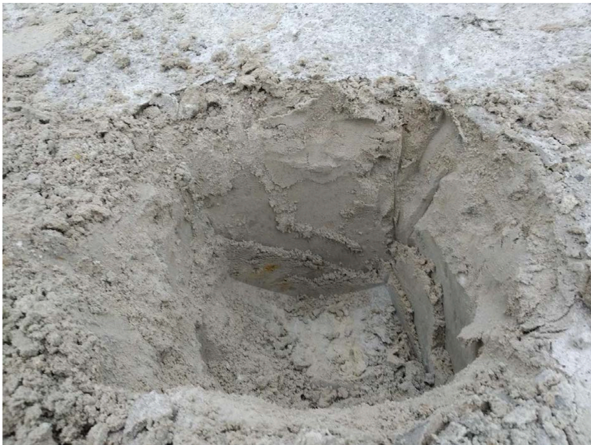
Рисунок 5.2 – Техногенные почвы