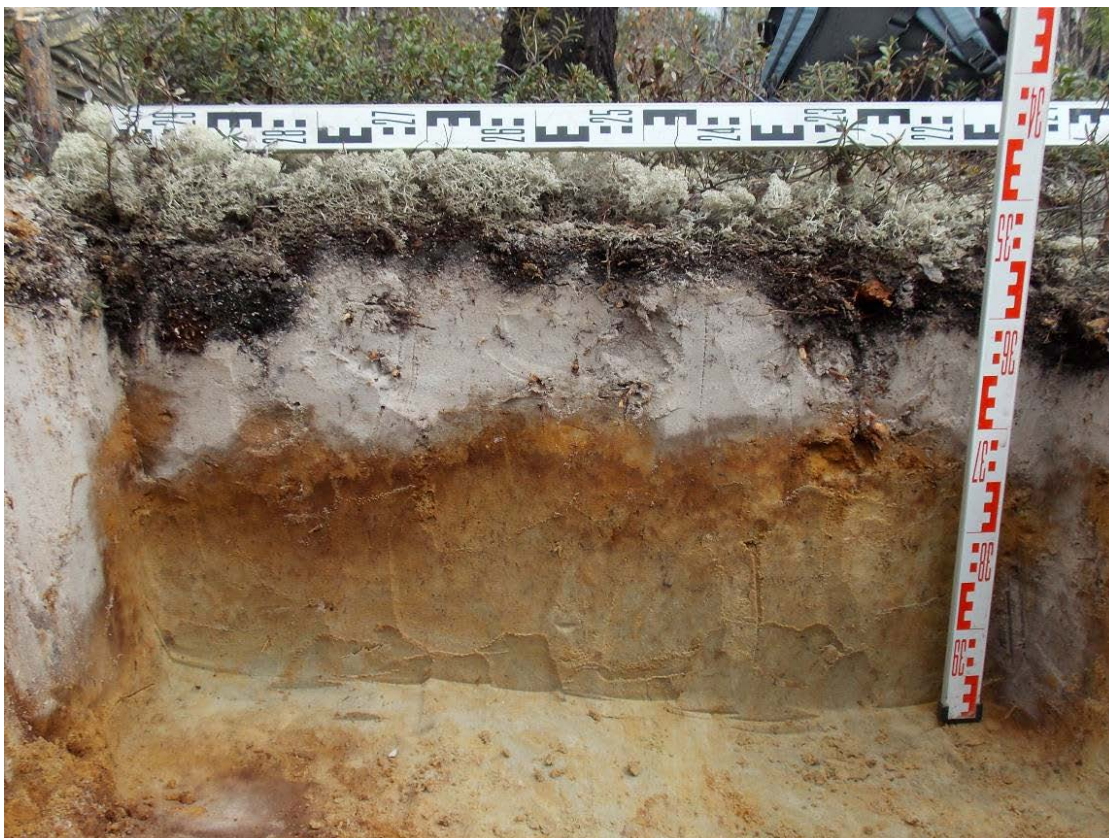
Рисунок 5.1 – Подзол иллювиально-железистый

Техногенные почвы представляют собой результат перемешивания исходных горизонтов профиля с непочвенными материалами (строительный и бытовой мусор) и привозным органосодержащим грунтом.