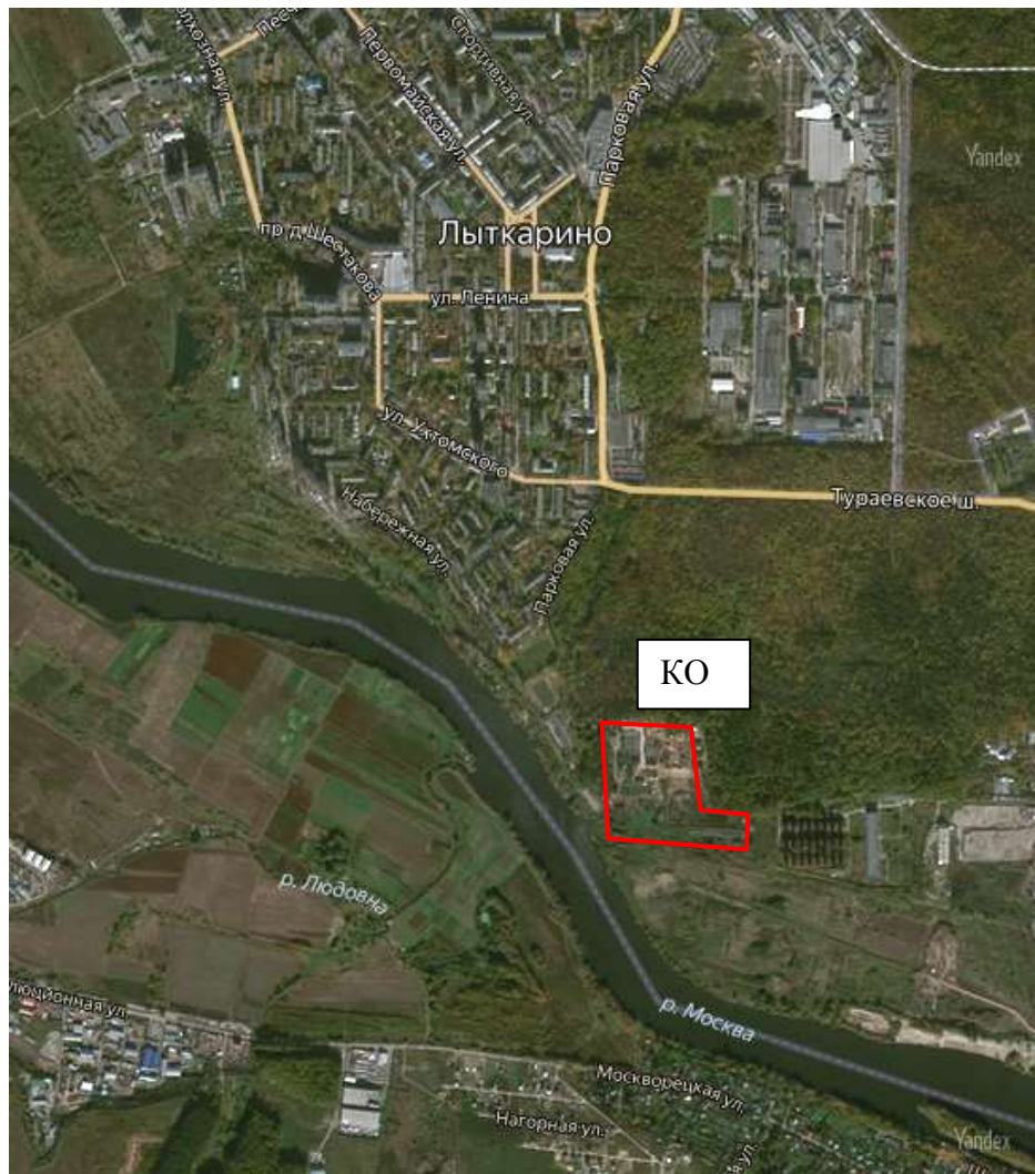
Рисунок 1.4.1 – Обзорная карта района работ

На рисунке 1.4.1 представлена карта-схема расположения КОС.