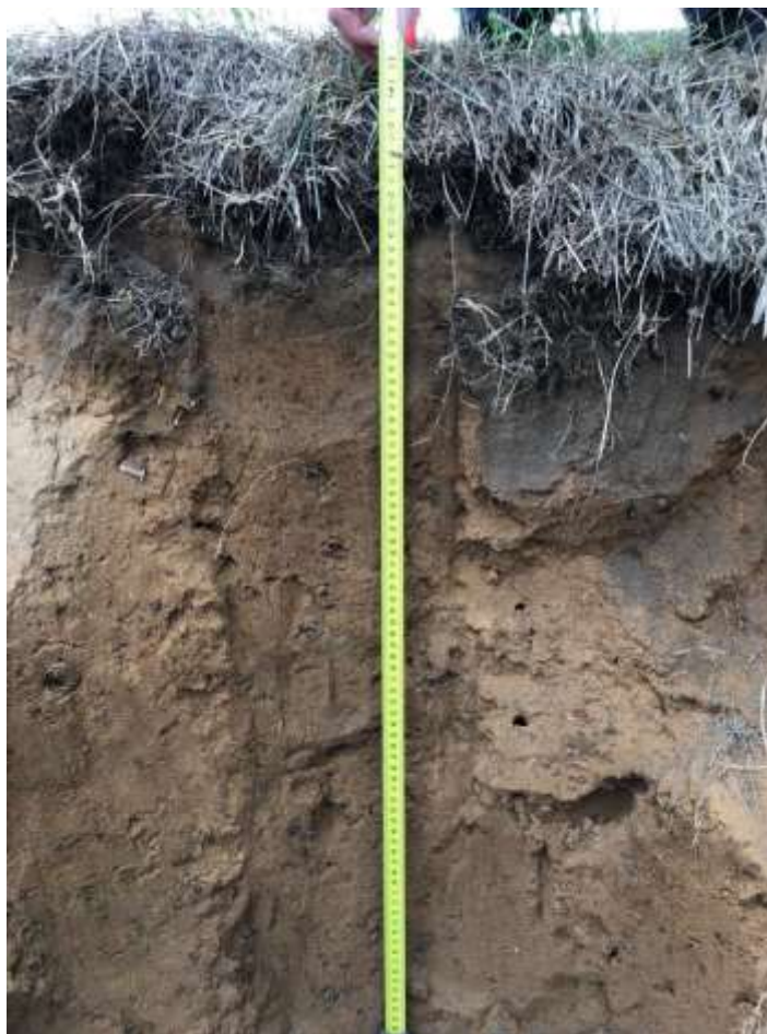
Рисунок 2.4.2 – Почвенный разрез

Мощность предполагаемого к снятию плодородного слоя почвы определена согласно рекомендациям Приложения 1 ГОСТ 17.5.3.06-85 «Охрана природы. Земли. Требования к определению норм снятия плодородного слоя почвы при производстве земляных работ» - 30 см.