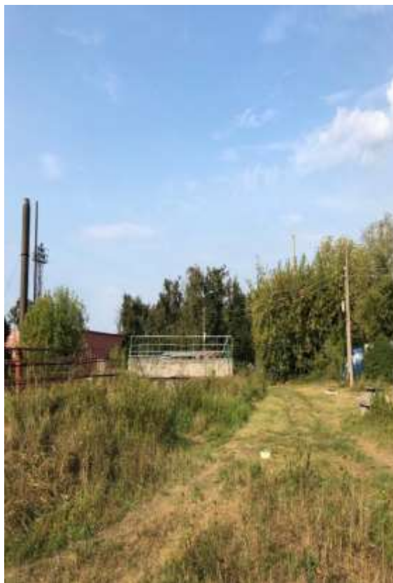
Рисунок 2.5.1 – Растительность участка проектирования

В настоящее время по ранее разработанной проектной документации выполнена расчистка территории от древесной растительности (восстановительная стоимость зеленых насаждений приведена в Приложении 2)