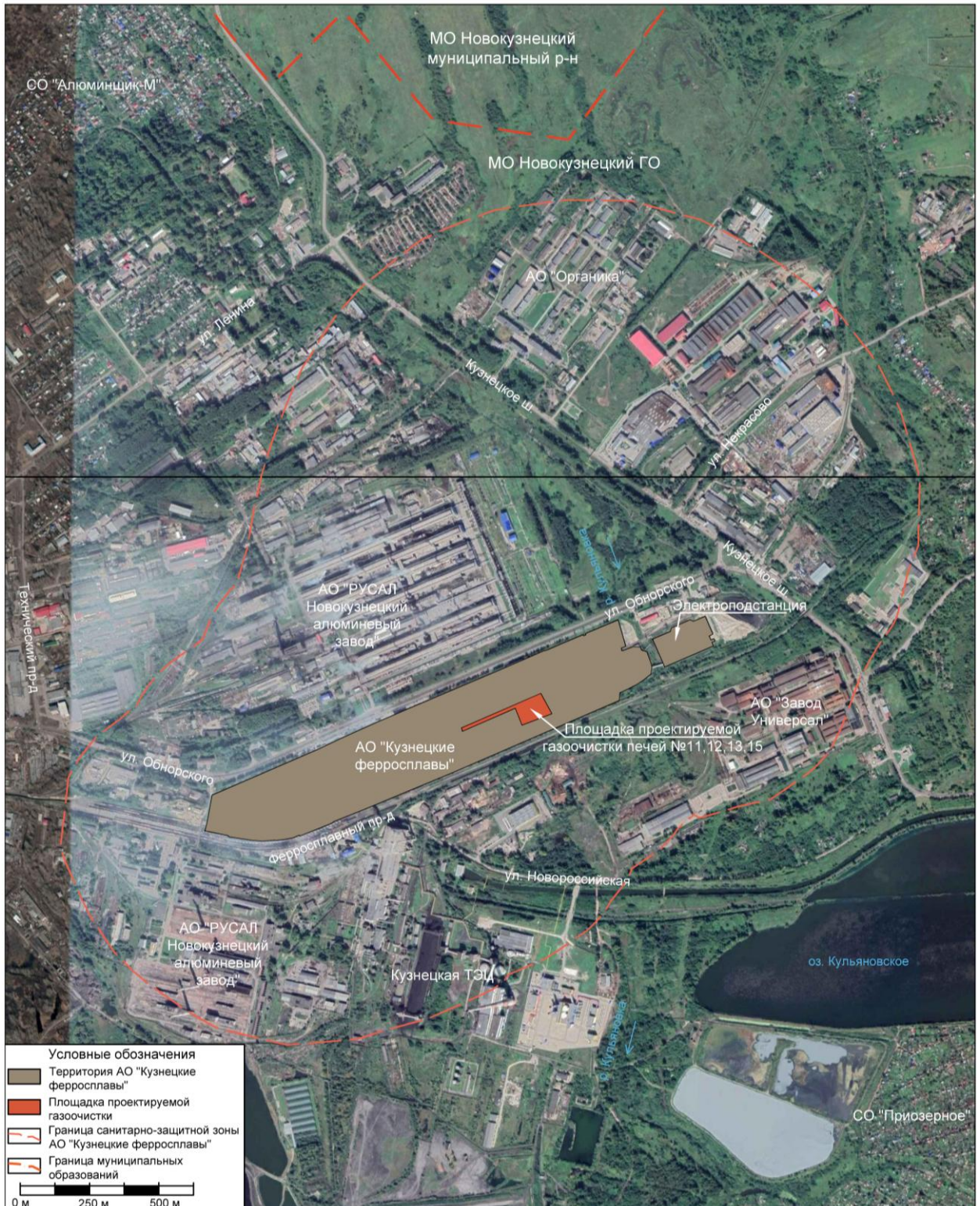
Рис. 2.4-1. Ситуационная карта-схема района расположения планируемого объекта АО «КФ»