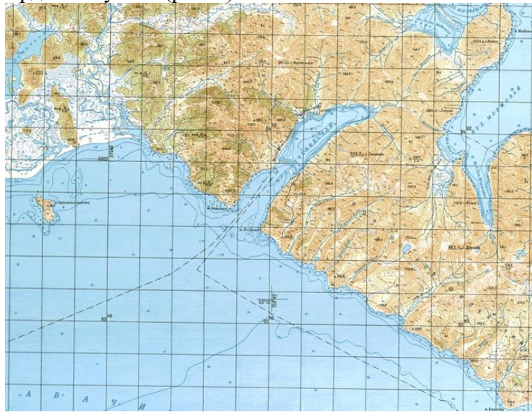
Рис. 1 — полуостров Шипунский, и бухта Бечевинская.

Протяженность бухты от открытой акватории Авачинского залива и до её кутовой части около 10 км. Ширина бухты в районе устьевой части около 2-х км. К кутовой части бухты её ширина уменьшается до 1 км. Бухта обрамлена горным массивом Шипунского полуострова и является типичной фиордовой бухтой (рис. 1)